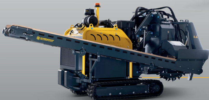
FRÉZOVACÍ KOLO MWS 630