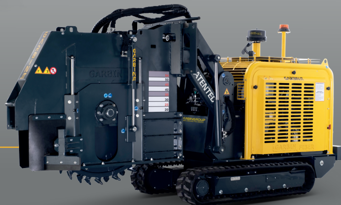
FRÉZOVACÍ KOLO S VYHAZOVACÍM PÁSEM MSW 540 NASTRO